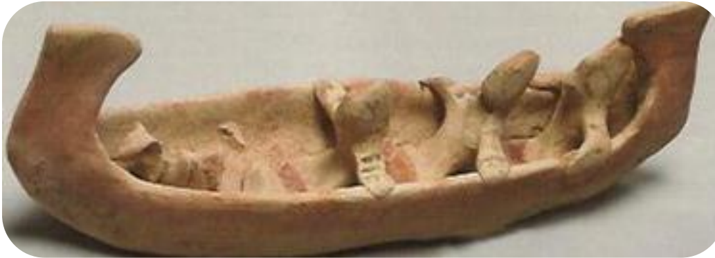
Πηγή 7: Φωτογραφία ευρήματος από την Κύπρο