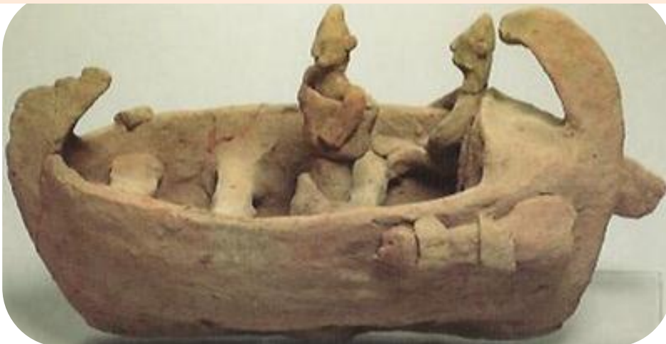
Πηγή 8: Φωτογραφία ευρήματος από την Κύπρο