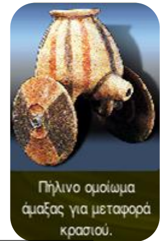
Πηλινο ομοίωμα άμαξας για μεταφορά κρασιού.