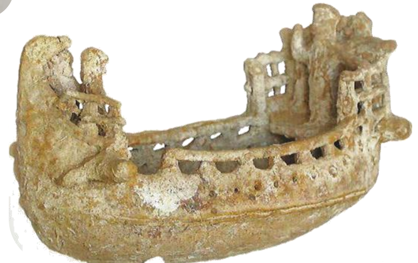
Πηγή 9: Φωτογραφία ευρήματος από την Κύπρο