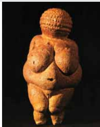
Άγαλμα γυναίκας από πέτρα.

Τώρα συγκρίνω και συζητώ τις απαντήσεις μου με τα παιδιά που κάθονται δίπλα μου: