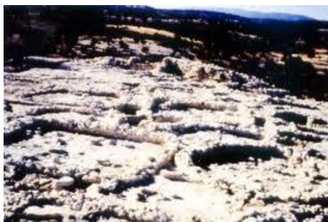
Αναπαράσταση του νεολιθικού οικισμού της