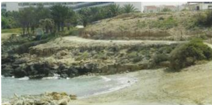
Νεολιθικός οικισμός στα Νησιά-Πρωταράς