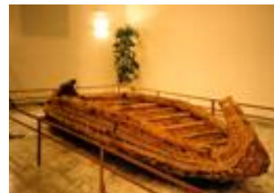
Φωτογραφίες παπυρέλλας 63

«Από τις αρχαιολογικές ανασκαφές στην Κύπρο έχουν βρεθεί πολλά ευρήματα της Νεολιθικής Εποχής όπως διάφορα εργαλεία, αγγεία, κοσμήματα, οικίες και τάφοι. Δεν έχουν βρεθεί μέχρι σήμερα κατάλοιπα από μέσα μετακίνησης (άμαξες ή τροχί) ούτε και οστά αλόγων. Οι αρχαιολόγοι υποθέτουν ότι η μετακίνηση στη θάλασσα γινόταν με σχεδίες φτιαγμένες από πάπυρο («παπυρέλλες») χωρίς όμως να έχουν βρεθεί σήμερα κατάλοιπα από τέτοιες σχεδίες».