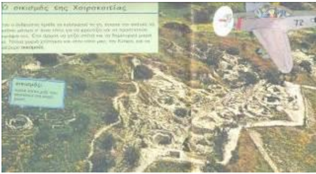
Αεροφωτογραφία του νεολιθικού οικισμού της Χοιροκοιτίας (Σχολικό βιβλίο Ο Άνθρωπος και η Ιστορία του. Από το λίθο στον πηλό, σ. 32-33)