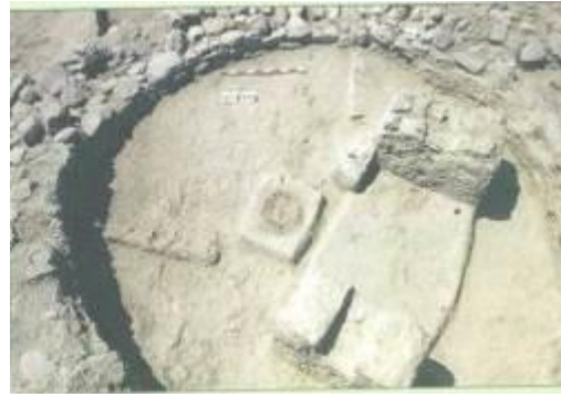
Κάτοψη σπιτιού στο νεολιθικό οικισμό της Χοιροκοιτίας (Σχολικό βιβλίο Ο Άνθρωπος και η Ιστορία του. Από το λίθο στον πηλό, σ. 46)