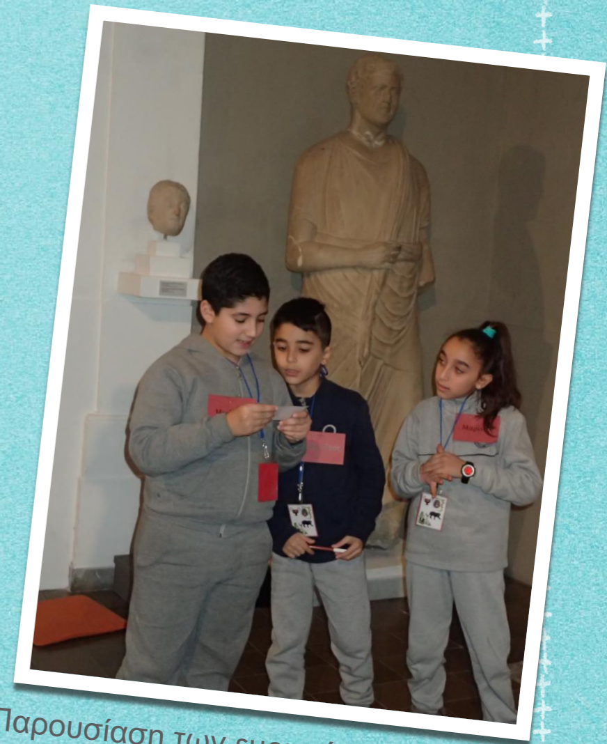
Παρουσίαση των ευρημάτων της εξερεύνησης