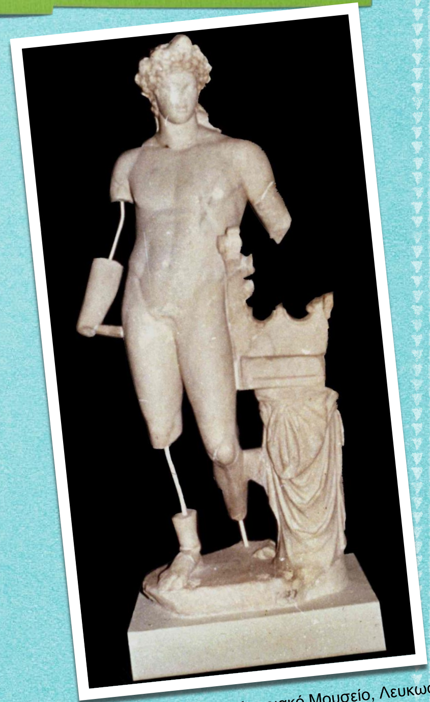
Άγαλμα Απόλλωνα, Σαλαμίνα, Κυπριακό Μουσείο, Λευκωσία