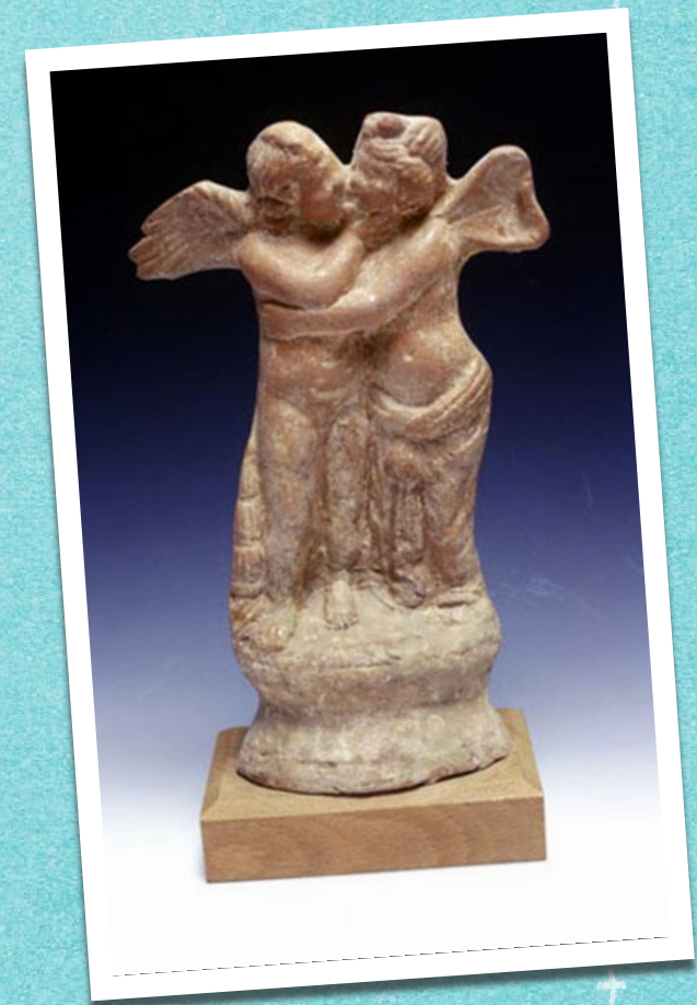
Πήλινο σύμπλεγμα Έρωτα και Ψυχής σε εναγκαλισμό, Κυπριακό Μουσείο, Λευκωσία)