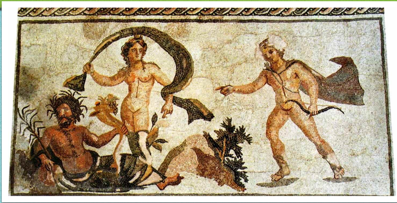
Απόλλωνας και Δάφνη, Ψηφιδωτό απο τον οίκο του Διονύσου. 3ος αιώνας μ.Χ., Πάφος