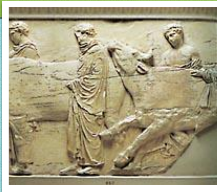
Πομπή των Παναθηναίων, Ζωφόρος του Παρθενώνα