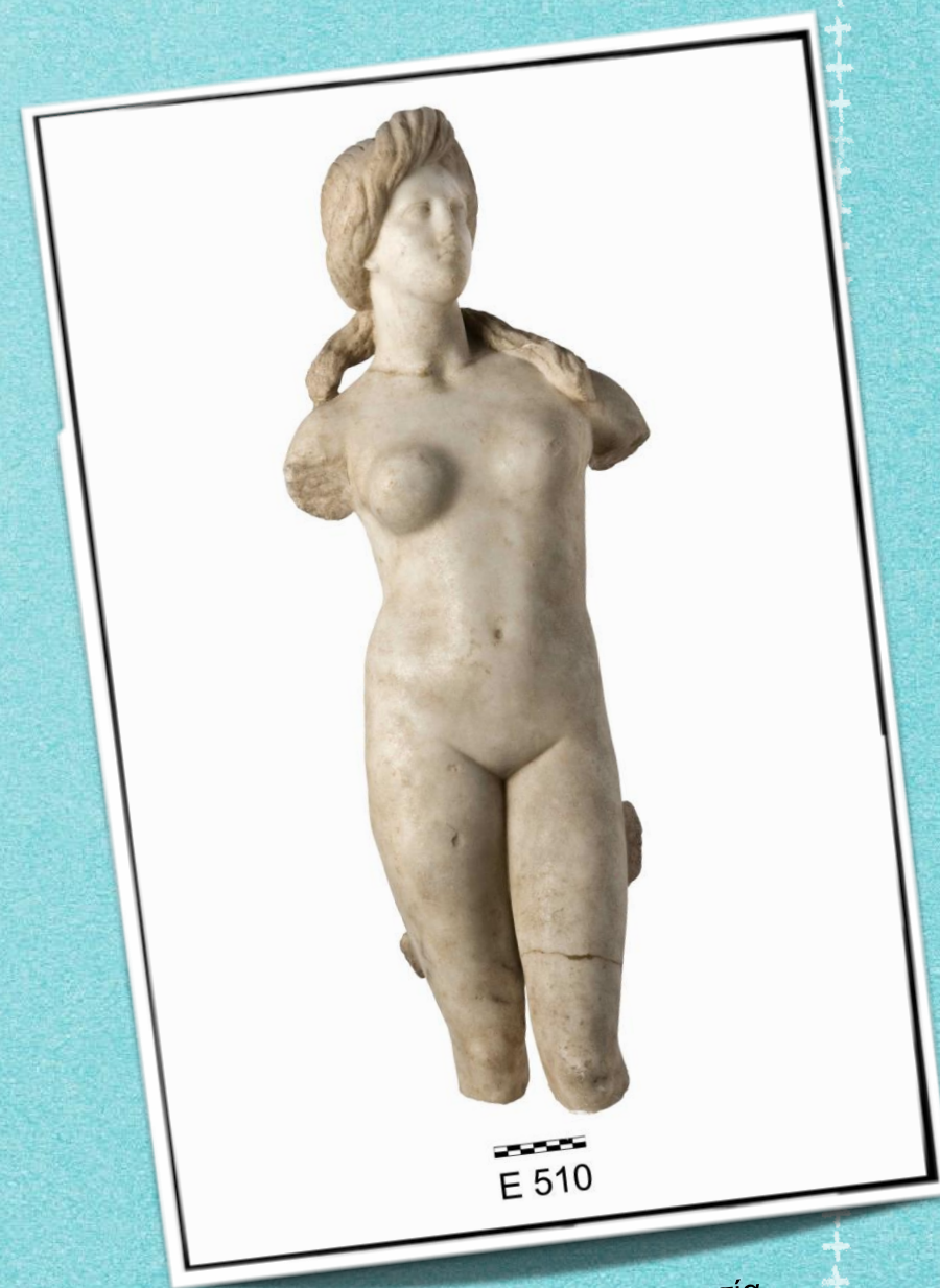
Αγάλμα Αφροδίτης, Σόλοι, Κυπριακό Μουσείο, Λευκωσία