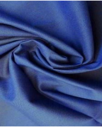
Απλά Ματ υφάσματα