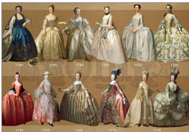
Εικόνα 1: Η Μόδα τα παλιά χρόνια