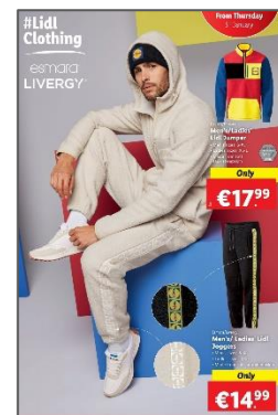
Εικόνα 9: Δημιουργία για το κατάστημα Lidl