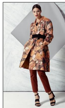
Εικόνα 8: Δημιουργία για το κατάστημα Marks & Spencers