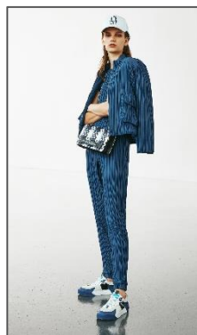
Εικόνα 7: Δημιουργία AX Armani