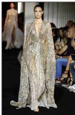
Εικόνα 6: Δημιουργία του Σχεδιαστή Μόδας Zuhair Murad