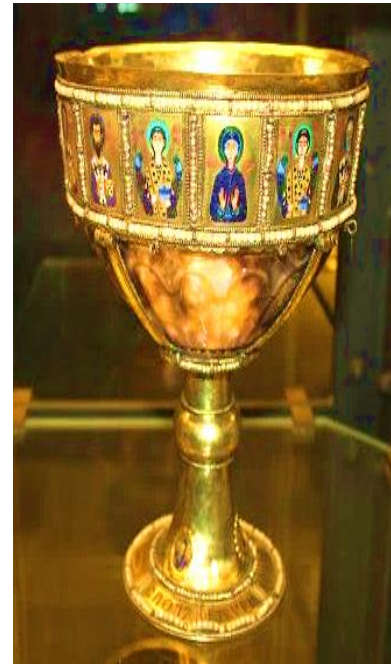
Δισκοπότηρο του βυζαντινού αυτοκράτορα Ρωμανού Β΄ (Βασιλική Αγίου Μάρκου, Βενετία)

Αφού μελετήσετε με προσοχή τα πιο πάνω παραθέματα και με βάση τις ιστορικές σας γνώσεις, να απαντήσετε στα πιο κάτω ερωτήματα: