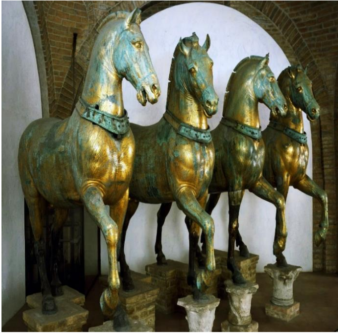
Άλογα που βρίσκονταν στον Ιππόδρομο της Κωνσταντινούπολης (Μουσείο Βασιλικής Αγίου Μάρκου, Βενετία)