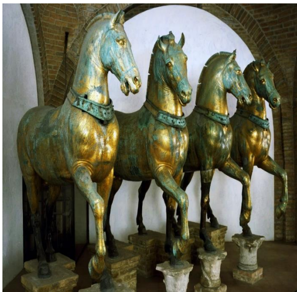
Άλογα που βρίσκονται στον Ιππόδρομο της Κωνσταντινούπολης (Μουσείο Βασιλικής Αγίου Μάρκου, Βενετία)