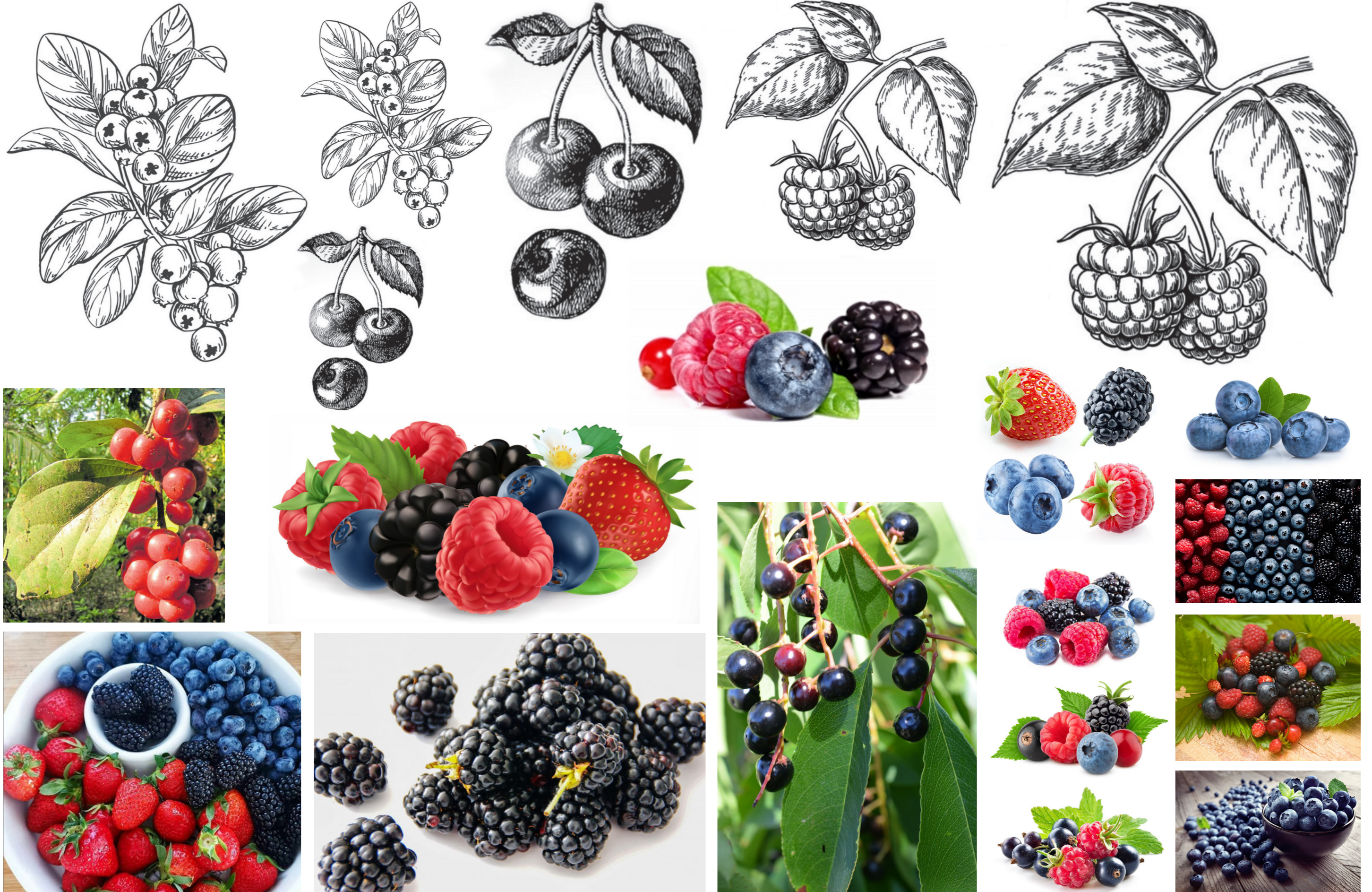
Η κοπή και η επικόλληση των στοιχείων δεν επιτρέπεται.