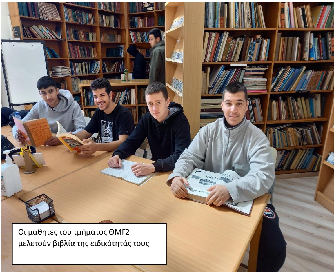
Οι μαθητές του τμήματος ΘΜΓ2 μελετούν βιβλία της ειδικότητάς τους