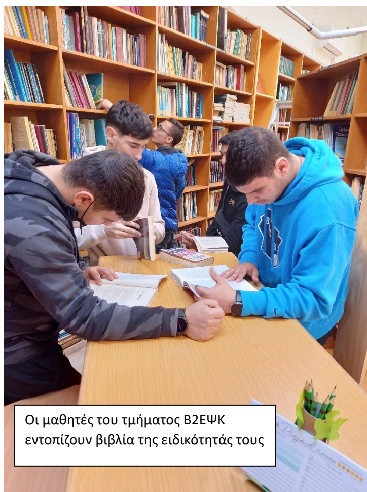
Οι μαθητές του τμήματος Β2ΕΨΚ εντοπίζουν βιβλία της ειδικότητάς τους