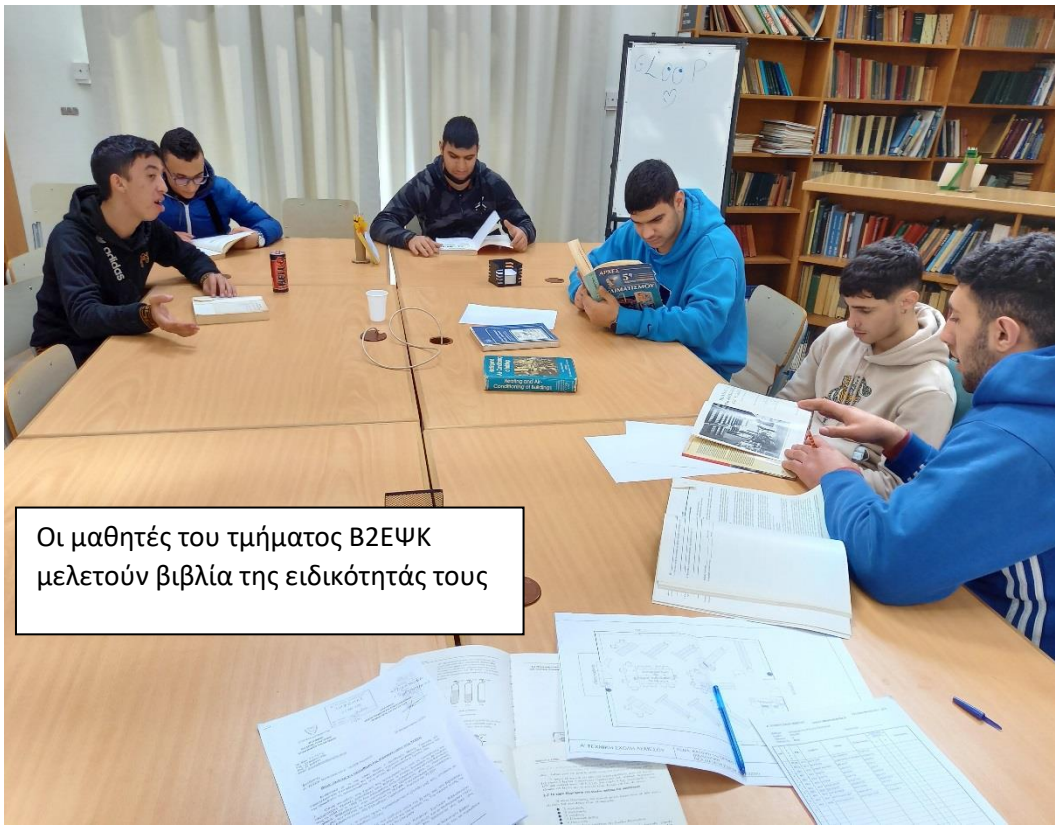
Οι μαθητές του τμήματος Β2ΕΨΚ μελετούν βιβλία της ειδικότητάς τους