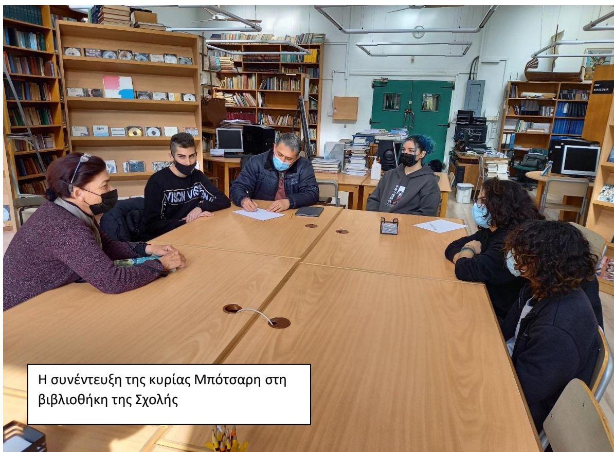
Η συνέντευξη της κυρίας Μπότσαρη στη βιβλιοθήκη της Σχολής