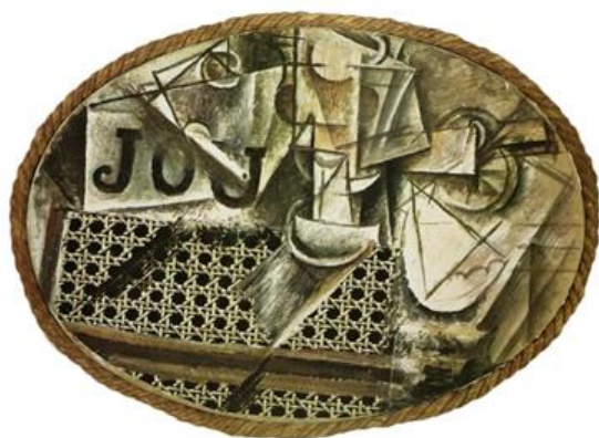
«Νεκρή φύση με ψάθινη καρέκλα», 1912 Μουσείο Γικάζο, Παρίσι

(Το έργο που παρουσιάζεται είναι ενδεικτικό )