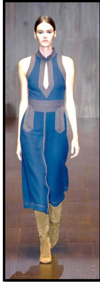
Εικόνα 5: Οίκος: Gucci, για το Καλοκαίρι 2015