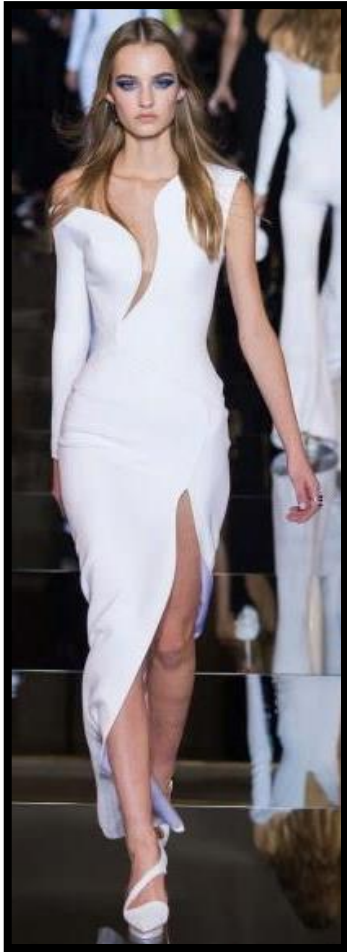
Εικόνα 4: Οίκος: Atelier Versace, για το Καλοκαίρι 2015

(β) Οι Εικόνες 4 και 5 παρουσιάζουν ενδύματα με φανερή τη «συμμετρική» και την «ασύμμετρη» ισορροπία.