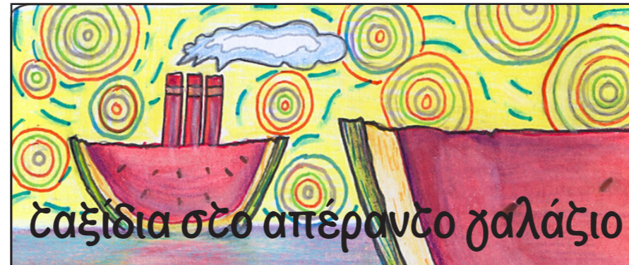
ΠΡΟΣΧΕΔΙΟ ΠΡΟΤΑΣΗΣ 1 (μονάδες 4)