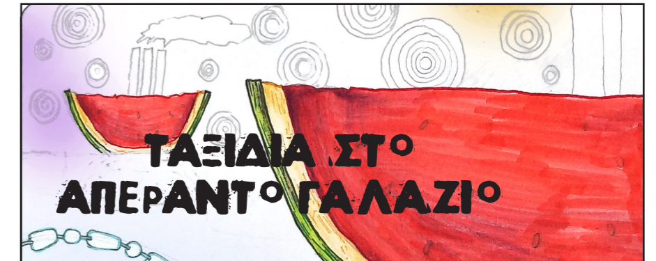
ΠΡΟΣΧΕΔΙΟ ΠΡΟΤΑΣΗΣ 2 (μονάδες 4)