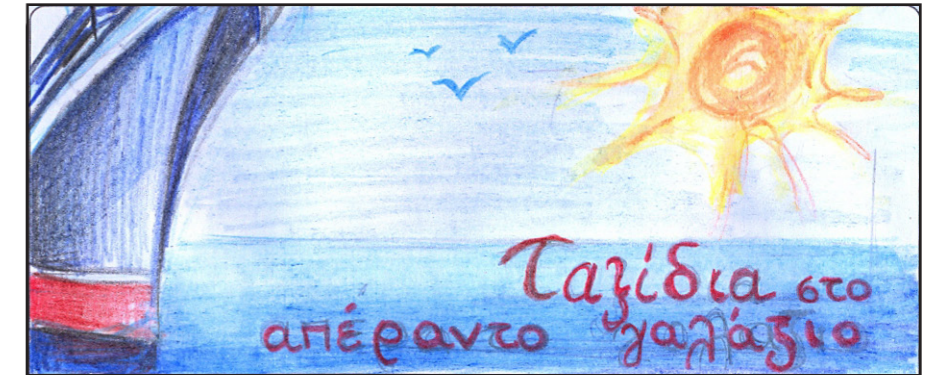
ΠΡΟΣΧΕΔΙΟ ΠΡΟΤΑΣΗΣ 2 (μονάδες 4)