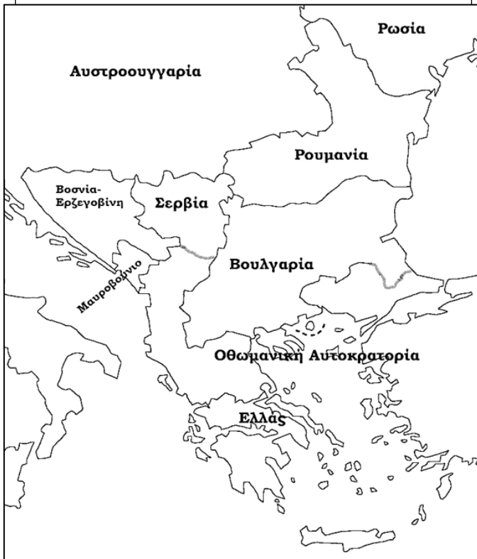
Χάρτης 1: Συνθήκη του Αγίου Στεφάνου (Μάρτιος 1878)