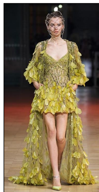
Εικόνα 3 Οίκος Μόδας Elie Saab