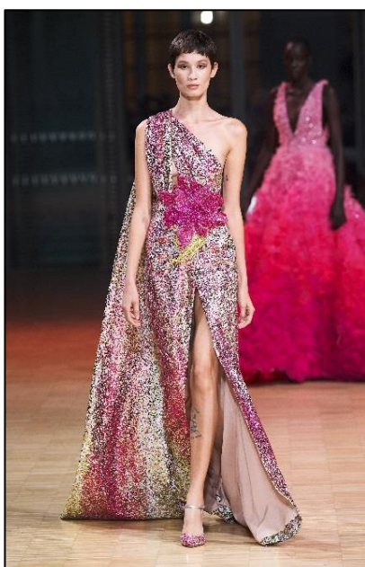
Εικόνα 4 Οίκος Μόδας Elie Saab