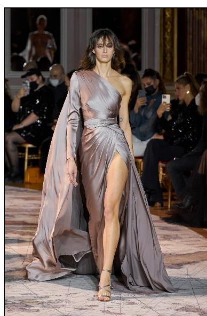
Εικόνα 5 Οίκος Μόδας Zuhair Murad