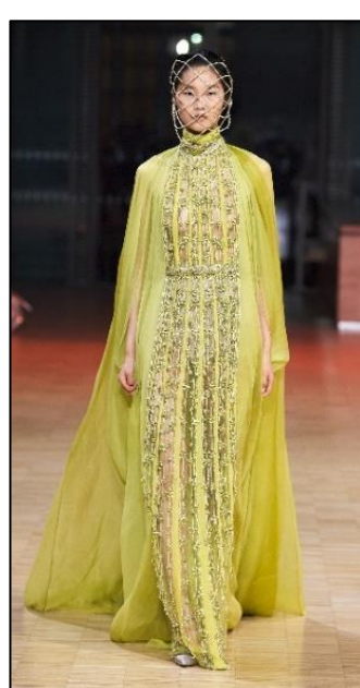
Εικόνα 6 Οίκος Μόδας Elie Saab