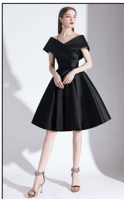
Εικόνα 1 Οίκος Μόδας Dunny & Nicole

Να μελετήσετε τα ενδύματα στις Εικόνες 1, 2, 3, 4, 5 και 6 και να απαντήσετε στα ερωτήματα που ακολουθούν.