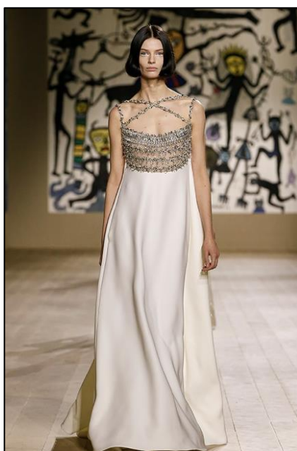
Εικόνα 2 Οίκος Μόδας Christian Dior