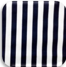
Εικόνα 2: Υφαντό βαμβακερό ύφασμα