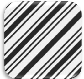
Εικόνα 4: Υφαντό βαμβακερό ύφασμα