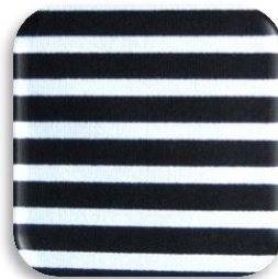
Εικόνα 3: Υφαντό βαμβακερό ύφασμα