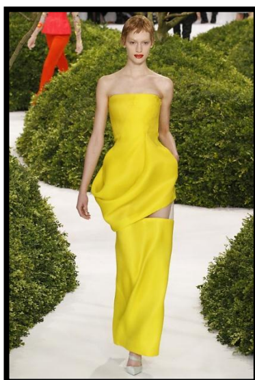
Εικόνα 1: Ένδυμα από τη συλλογή του οίκου Christian Dior για το Γαλλικό Fashion Week Haute-Couture, Καλοκαίρι 2013