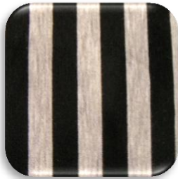
Εικόνα 1: Πλεχτό ύφασμα Τζέρσεϊ

(α) Να σχεδιάσετε ένα καλοκαιρινό ένδυμα το οποίο να είναι ιδανικό για ένα κοντό γυναικείο σώμα με βαρύ σκελετό στο κάτω μέρος.