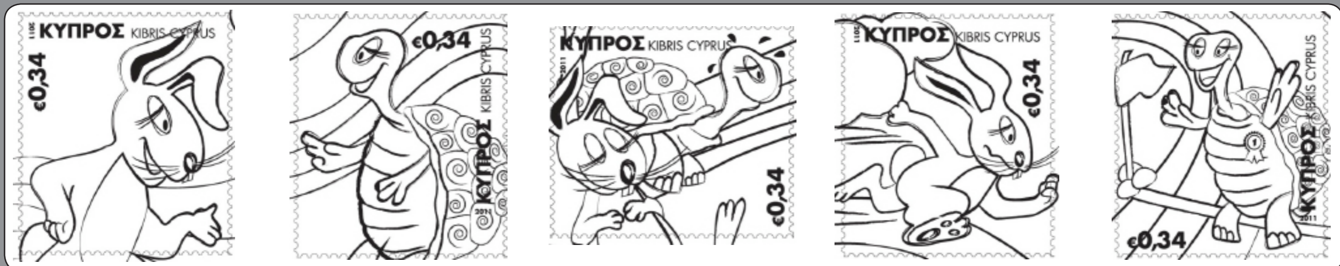
Σειρά γραμματοσήμων «Ο λαγός και η χελώνα» - Κυπριακά Ταχυδρομεία