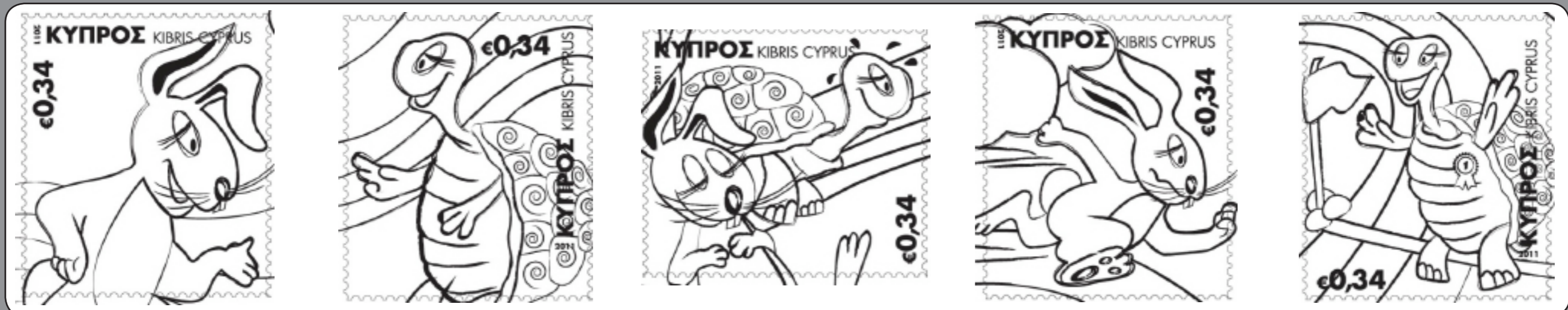
Σειρά γραμματοσήμων «Ο λαγός και η χελώνα» - Κυπριακά Ταχυδρομεία