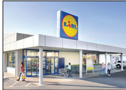
Εικόνα 2 -Κατάστημα LIDL