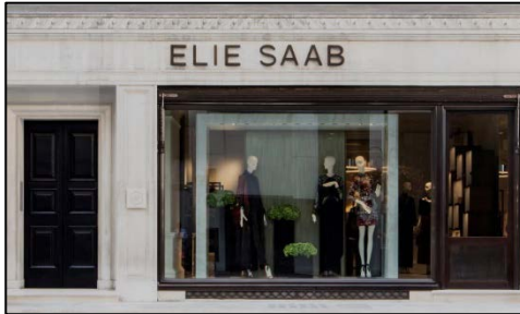
Εικόνα 1 - Κατάστημα του σχεδιαστή Μόδας ELIE SAAB