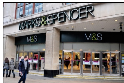
Εικόνα 4 - Κατάστημα MARKS & SPENCER