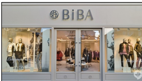
Εικόνα 3 - Κατάστημα BIBA