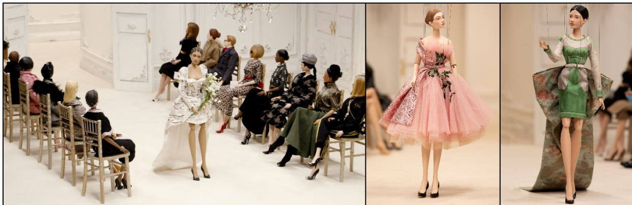
Εικόνα 5 - Συλλογή του σχεδιαστή Μόδας Jeremy Scott, για τον οίκο Moschino

Ο σχεδιαστής Μόδας Jeremy Scott λόγω της πανδημίας, στην προσπάθειά του να αποφύγει το συγχρωτισμό κοινού σε μία δια ζώσης επίδειξη Μόδας, οργάνωσε και πρόβαλε την νέα συλλογή Μόδας του οίκου Moschino σε μία πρωτοποριακή θεατρική μικρογραφία πασαρέλας στην οποία παρέλασαν κούκλες/μαριονέτες φορώντας ντελικάτες μικρογραφίες των δημιουργιών του σχεδιαστή Μόδας. Τη θεατρική μικρογραφία της επίδειξης Μόδας παρακολουθούσαν, ως κοινό, κούκλες διάσημων προσωπικοτήτων του επαγγελματικού πεδίου της Μόδας, όπως η εκδότρια της αμερικάνικης Vogue, Anna Wintour.