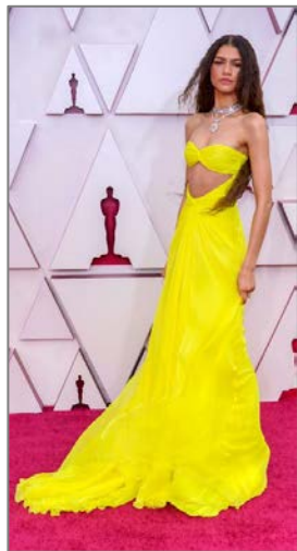
Εικόνα 4 H Zendaya με ένδυμα Valentino Haute Couture.