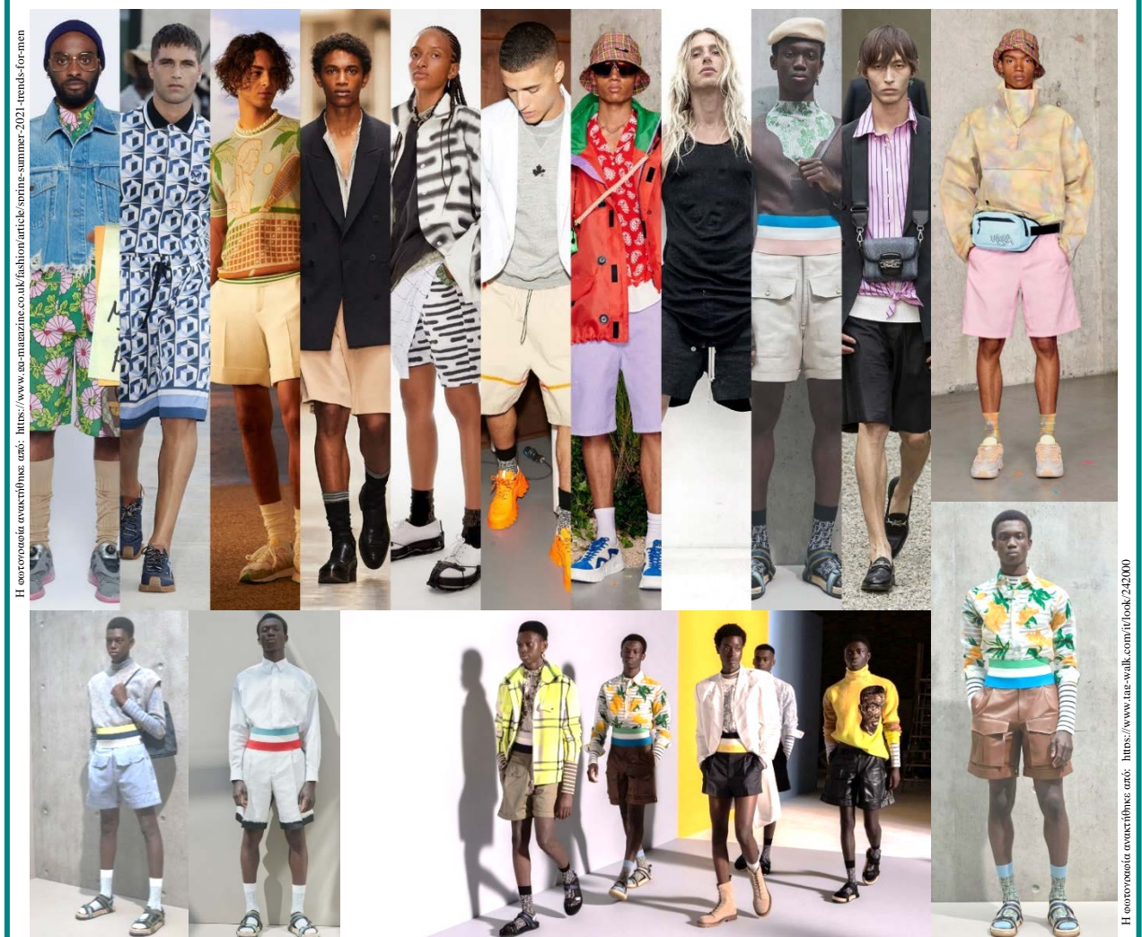
Εικόνα 10 – Τάση Μόδας για ανδρικό ένδυμα «Βερμούδα»

Η Εικόνα 10 – Τάση Μόδας για ανδρικό ένδυμα «Βερμούδα» , παρουσιάζει μία από τις σημαντικότερες τάσεις της Ανδρικής Μόδας για τη σεζόν Καλοκαίρι 2021, η οποία προβλήθηκε έντονα σε όλες τις πασαρέλες των ανδρικών ντεφιλέ. Οι καινοτόμες σχεδιαστικές εκδοχές της «Βερμούδας» σε διάφορα μήκη και φάρδη, αναμένεται να απαρτίσουν ένα βασικό κομμάτι της ανδρικής γκαρνταρόμπας για το καλοκαίρι 2021. Οι σχεδιαστές Μόδας λανσάρουν τις ανδρικές Βερμούδες συνδυασμένες με άνετα τζέρσεϋ μπλουζάκια, με πολύχρωμα πουκάμισα, με ανάλαφρα βαμβακερά «Hoodies», καθώς και με δερμάτινα «Biker» ή τζιν σακάκια.