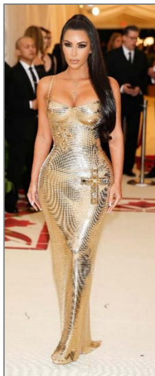
Εικόνα 6 Kim Kardashian

3. (α) Οι Εικόνες 6, 7, 8 και 9 , παρουσιάζουν τέσσερις (4) διάσημες προσωπικότητες οι οποίες δραστηριοποιούνται στο χώρο της «Show-Biz». Να συμπληρώσετε τις προτάσεις που ακολουθούν παρακάτω. (Μονάδες 2)