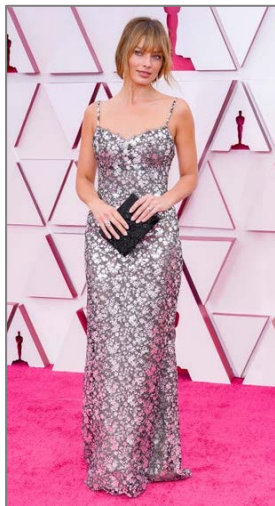
Εικόνα 3 H Margot Robbie με ένδυμα Chanel Haute Couture.