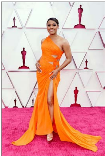
Εικόνα 2 H Ariana DeBose με ένδυμα της Vera Wang.

2. Η απονομή των βραβείων «Oscar» 2021, αποτέλεσε το πρώτο σημαντικό καλλιτεχνικό γεγονός της «Show-Biz» το οποίο πραγματοποιήθηκε με τη φυσική παρουσία των καλλιτεχνών στο χώρο της απονομής. Το γεγονός αυτό, έδωσε την ευκαιρία στους σχεδιαστές καθώς και στους στιλίστες Μόδας να εντυπωσιάσουν το κοινό με τις δημιουργίες τους. Στις Εικόνες 2, 3, 4 και 5 , παρουσιάζονται μερικές από τις εμφανίσεις διάσημων ηθοποιών κατά τη διάρκεια της βραδιάς απονομής των βραβείων «Όσκαρ» 2021.