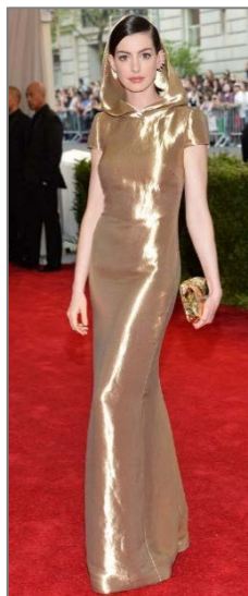
Εικόνα 8 Anne Hathaway