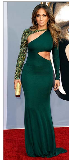
Εικόνα 9 Jennifer Lopez