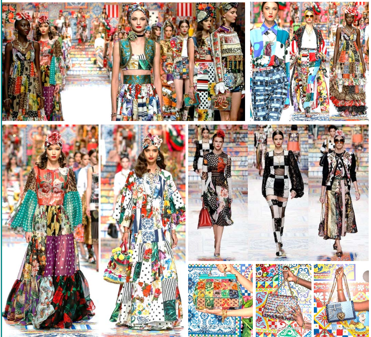
Εικόνα 1 – Συλλογή Μόδας Dolce & Gabbana, καλοκαίρι 2021