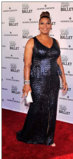
Εικόνα 7 Queen Latifah