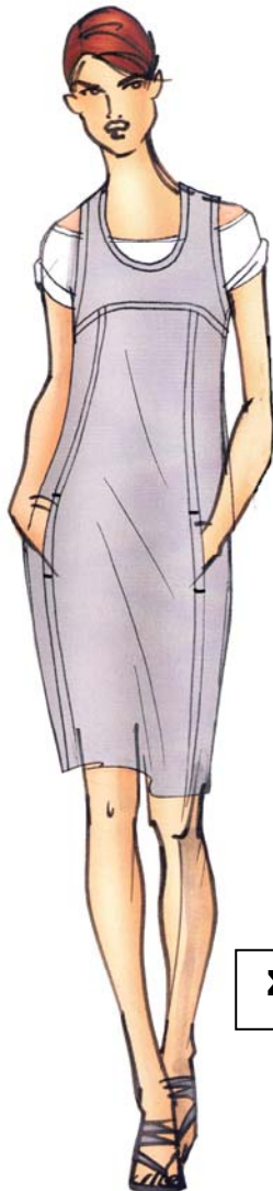
Σχέδιο Ενδύματος, σκίτσο 3