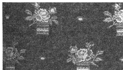
(β) Ύφασμα με σχέδια που έχουν φανερή κατεύθυνση