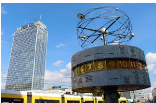
Alexanderplatz im Zentrum von Berlin

Meine Eltern sind geschieden. Mein Vater und meine anderen Geschwister leben nicht mit uns zusammen. Wir wohnen im Zentrum von Berlin, auf dem Alexanderplatz in der Nähe vom Fernsehturm. Ich brauche nur fünf Minuten zu Fuß bis zum Bahnhof. Das ist ganz praktisch. Da fahren viele Züge, S- Bahnen, U- Bahnen und Busse. Am Alexanderplatz können wir sehr gut einkaufen, ins Kino gehen und bummeln.