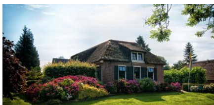
Das Haus in Frankreich