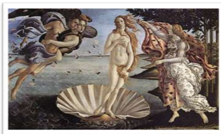
“Η γέννηση της Αφροδίτης”, Σάντρο Μποτιτσέλλι

Ο επικρατέστερος μύθος για την προέλευσή της, αναφέρει ότι αυτή γεννήθηκε σε μια ακτή της Πάφου στην Κύπρο, με την ονομασία “Πέτρα του Ρωμιού”. Από εκεί, ο άνεμος Ζέφυρος την έσπρωξε με ένα απαλό φύσημα στη θάλασσα, μέσα σε κατάλευκα αφρισμένα κύματα. Την υποδέχτηκαν οι Ώρες, οι οποίες την έντυσαν με πλούσια ενδύματα από πορφύρα και μετάξι. Ακολούθως, έπλεξαν τα μαλλιά της και τα στερέωσαν με μια μαλαματένια πόρπη (καρφίτσα). Για να της δώσουν ακόμα πιο επιβλητική όψη, στόλισαν το λαιμό της με πολύτιμα περιδέραια και της φόρεσαν μαργαριταρένια σκουλαρίκια. Όταν τελείωσαν, τη μετέφεραν στον Όλυμπο. Όλοι οι θεοί θαμπώθηκαν από την ομορφιά της, και πολλοί ήθελαν να την κάνουν γυναίκα τους.