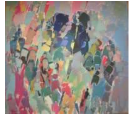
Επιστροφή γυναικών, 1989

Περιγραφή: Ενώ τα παιδιά βρίσκονται ακόμη μπροστά στο έργο του Σεργίου, τους δίνεται η οδηγία να ζωγραφίσουν με μολύβι στα εικαστικά τους ημερολόγια μια ανθρώπινη φιγούρα που να έχει αρκετές λεπτομέρειες π.χ. να κρατά τη τσάντα της, να φορά καπέλο, ζώνη κτλ. Κάθε φορά που θα χτυπά η κουδούνα θα αφαιρούν μια λεπτομέρεια. Π.χ. στο πρώτο χτύπημα θα σβήσουν το καπέλο, στο δεύτερο θα σβήσουν τα χαρακτηριστικά του προσώπου, στο τρίτο χτύπημα θα σβήσουν τα μαλλιά κτλ. Ακολούθως χρωματίζουν με ένα χρώμα μαρκαδόρου τη φιγούρα τους και την κόβουν. Τίθεται ο προβληματισμός: Σε ποιο έργο διακρίνουν αφαιρετικές φιγούρες; Ψάχνουν στον χώρο και εντοπίζουν το έργο που έχει αφαιρετικές φιγούρες.