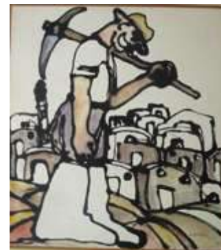
Λευτέρη Σεργίου, Σύνθεση με φιγούρα- Το βάρος, 1977