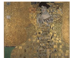
Gustav Klimt: Portrait von Adele Bloch-Bauer