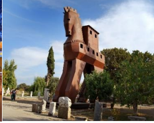
4. TRUVA ANTİK KENTİ