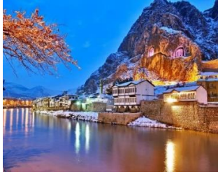
3. AMASYA'NIN NEHRİ