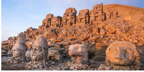
1. TANRILARIN MEKANI NEMRUT