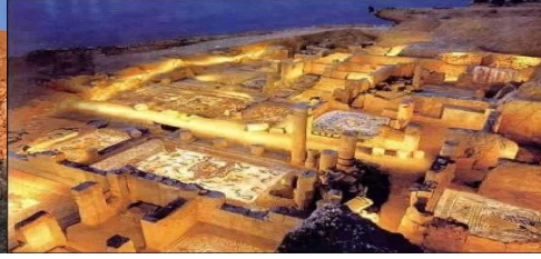
2. MOZAIK KENT: ZEUGMA