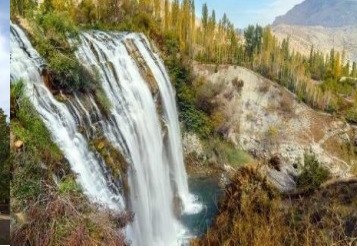
5. TORTUM ŞELALESİ