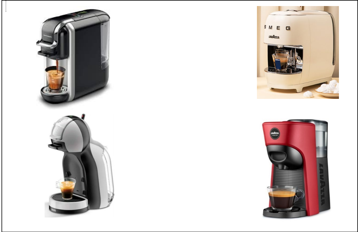
Πλαίσιο Αρ. 1