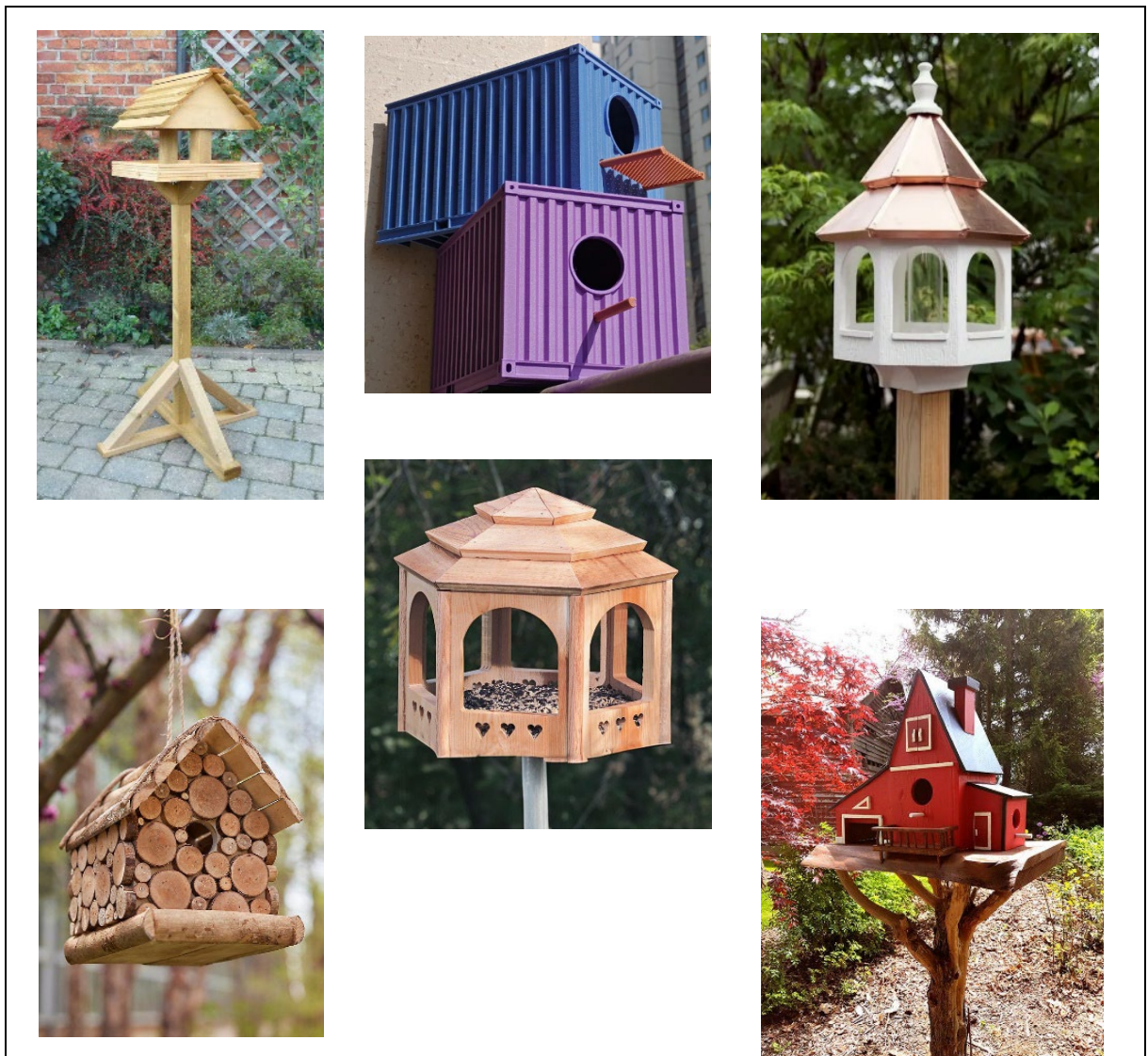
Πλαίσιο Αρ. 2

Στο Πλαίσιο Αρ. 2 δείχνει παραδείγματα από άλλα σπιτάκια για έμπνευση.