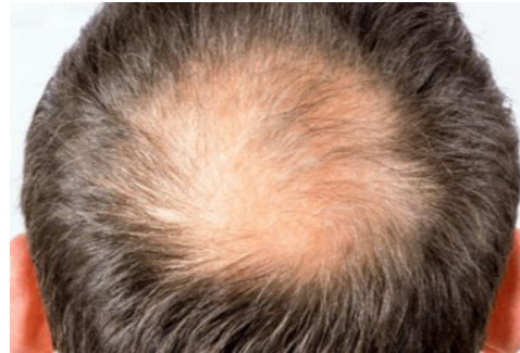
Εικόνα 1 ..... Εικόνα 2 .....