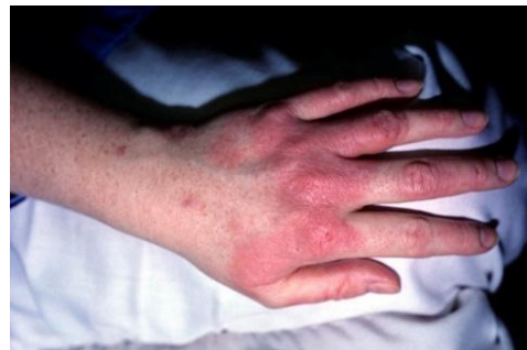
Εικόνα 3 ..... Εικόνα 4 .....

2. Να αναφέρετε τέσσερις (4) λόγους για τους οποίους είναι σημαντική η ομαδική εργασία σε ένα κομμωτήριο.