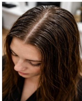
Εικόνες 9 και 10