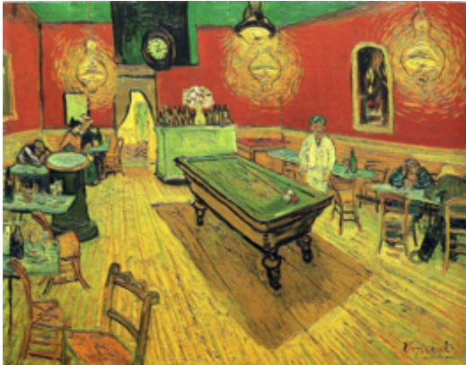
Μετά - Ιμπρεσιονισμός

Μετά-Ιμπρεσιονισμός, Ρεαλισμός, Αναγέννηση, Μπαρόκ, Νεοκλασικισμός, Ρομαντισμός, Ιμπρεσιονισμός, Μανιερισμός