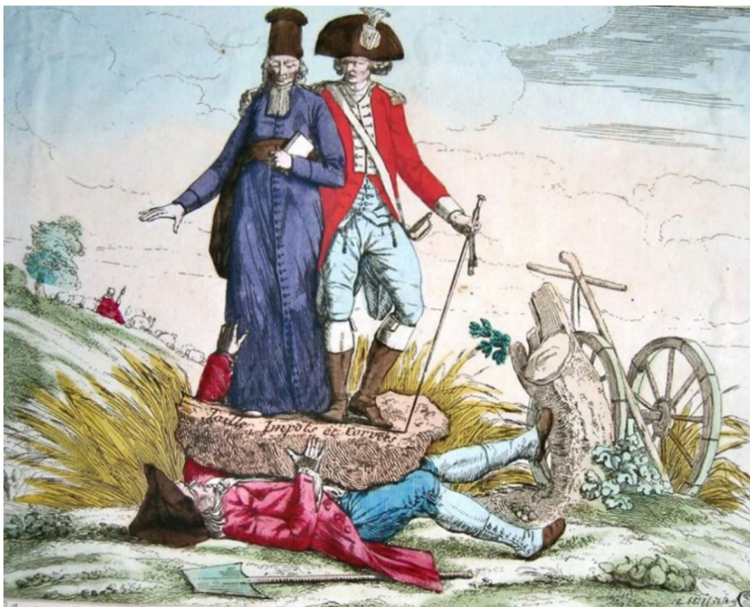
Η Γαλλική Επανάσταση, γκραβούρα, 1789 (Μουσείο Carnavalet, Παρίσι)

https://www.pinterest.com/french0956/the-french-revolution/