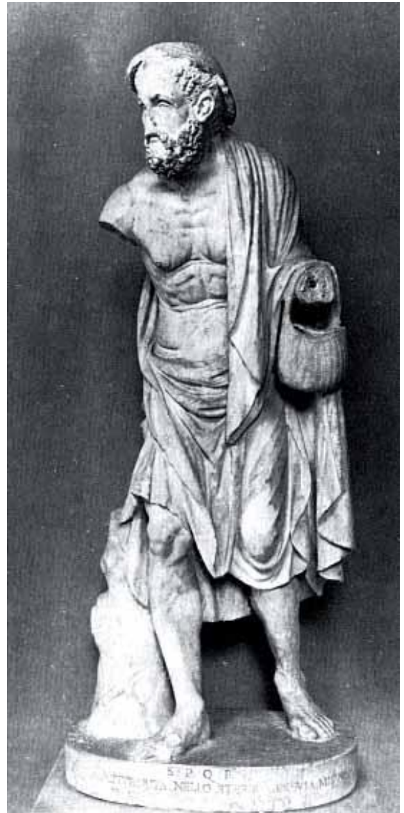
Γερο-φαράς, Ρώμη, Μουσείο Conservatori