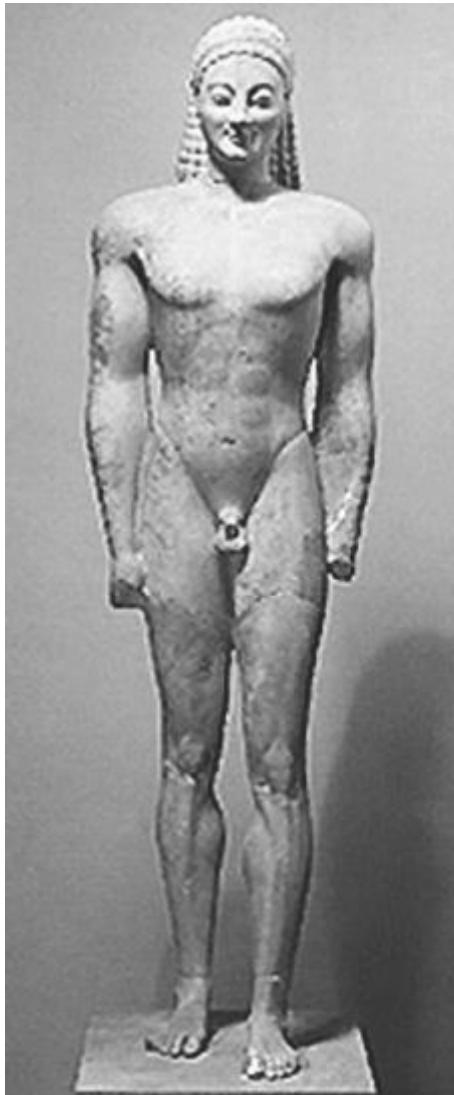
Κούρος της Βολομάνδρας, Αθήνα, Εθνικό Αρχαιολογικό Μουσείο

α. Να αντιστοιχίσετε τα Αγάλματα I, II και III με την κατάλληλη εποχή που αντιπροσωπεύει το καθένα, σημειώνοντας στο τετράδιο απαντήσεών σας την ονομασία της εποχής και δίπλα τον αριθμό κάθε αγάλματος.