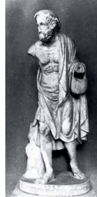
Γερο-ψαράς, Ρώμη, Μουσείο Conservatori