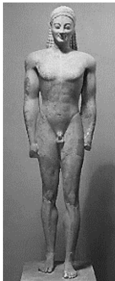
Κούρος της Βολομάνδρας, Αθήνα, Εθνικό Αρχαιολογικό Μουσείο