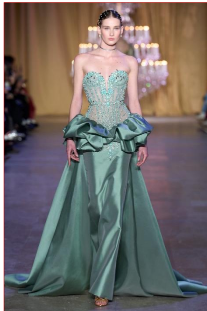
Εικόνα 2 Zuhair Murad