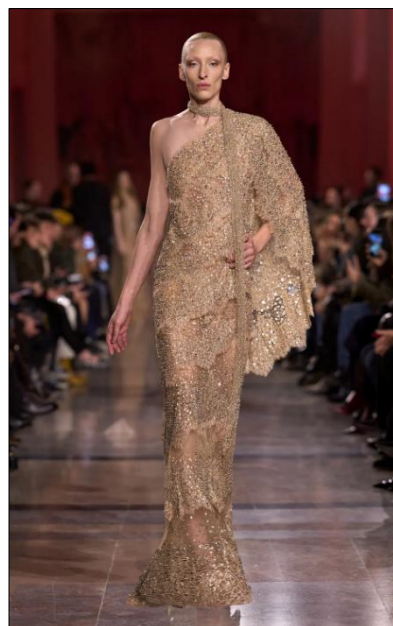
Εικόνα 6 Elie Saab