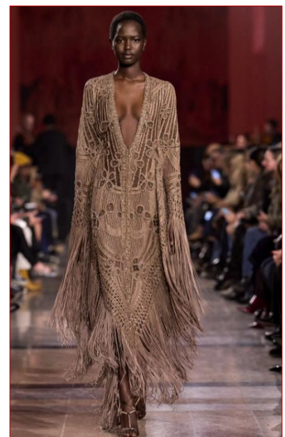
Εικόνα 7 Elie Saab