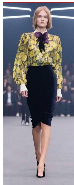
Εικόνα 3 Valentino