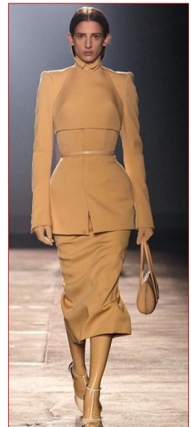
Εικόνα 4 Mugler