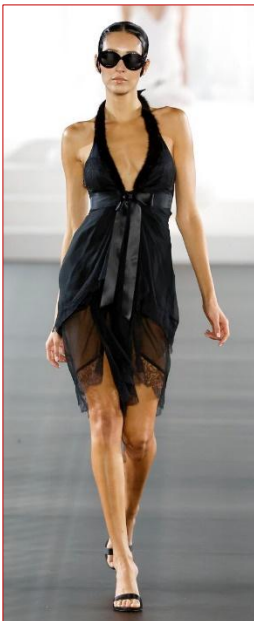
Εικόνα 1 Celia Kritharioti

Οι Εικόνες 1, 2, 3, 4, 5, 6 και 7 παρουσιάζουν δημιουργίες από συλλογές οίκων Μόδας της σεζόν Άνοιξη / Καλοκαίρι 2026. Με βάση τη μελέτη των χαρακτηριστικών των ενδυμάτων που παρουσιάζονται στις εικόνες, να απαντήσετε στα ακόλουθα ερωτήματα.