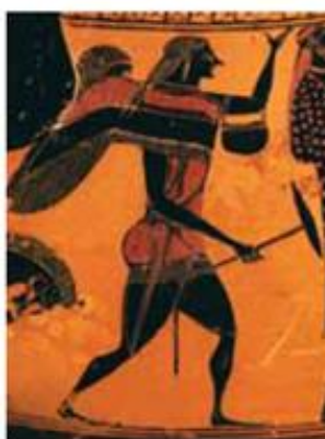
Μελανόμορφος αμφορέας που απεικονίζει τον Αρισταίο, γύρω στο 540 π.Χ. Ελληνική Μυθολογία , Εκδοτική Αθηνών, τόμος 3ος, Αθήνα, 1986

Οι Νύμφες πάλι του έμαθαν πώς να καλλιεργεί τα αμπέλια και τις ελιές, πώς να φροντίζει τα μελίσσια και πώς να κάνει το γάλα τυρί. Ο τόπος εκεί ήταν γεμάτος αγριελιές κι οι Νύμφες τού έδειξαν πώς να τις καλλιεργεί, να τις μπολιάζει για να δίνουν καρπό, να αλέθει τον καρπό του ελαιόδεντρου και να παίρνει το πολύτιμο αλλά άγνωστο ως τότε ελαιόλαδο. Οι αρχαίοι πίστευαν πως ο Αρισταίος ανακάλυψε το ελαιοπιεστήριο και έτσι τους έδειξε τον τρόπο να παίρνουν εύκολα το λάδι από τις ελιές.