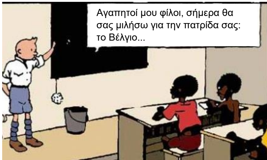
Κωμικογράφημα: Αίθουσα διδασκαλίας κάπου στο Κογκό